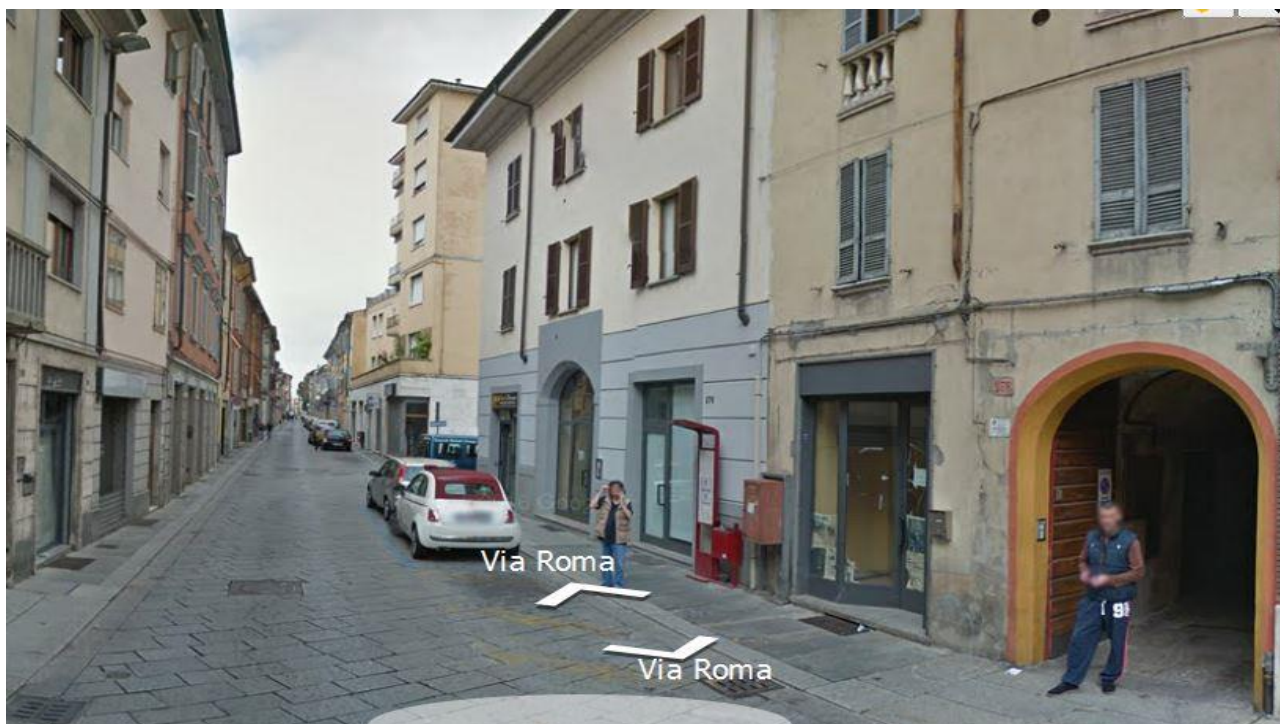
Gruppo D – Piacenza, Via Roma

E' concentrato principalmente nei comuni con più di 20.000 abitanti del centro nord.