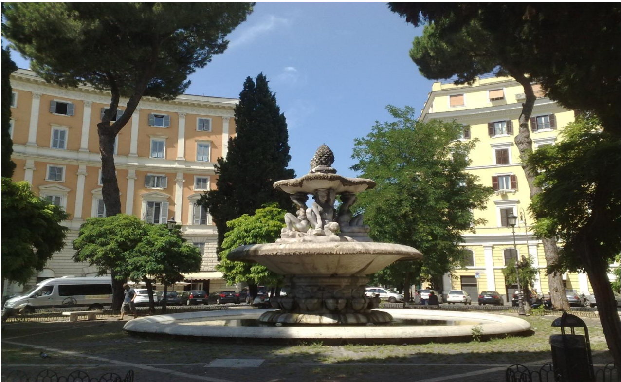
Gruppo A – Roma, Piazza dei Quiriti

E' concentrato principalmente nei centri storici delle grandi città e nei capoluoghi di provincia soprattutto del centro nord.