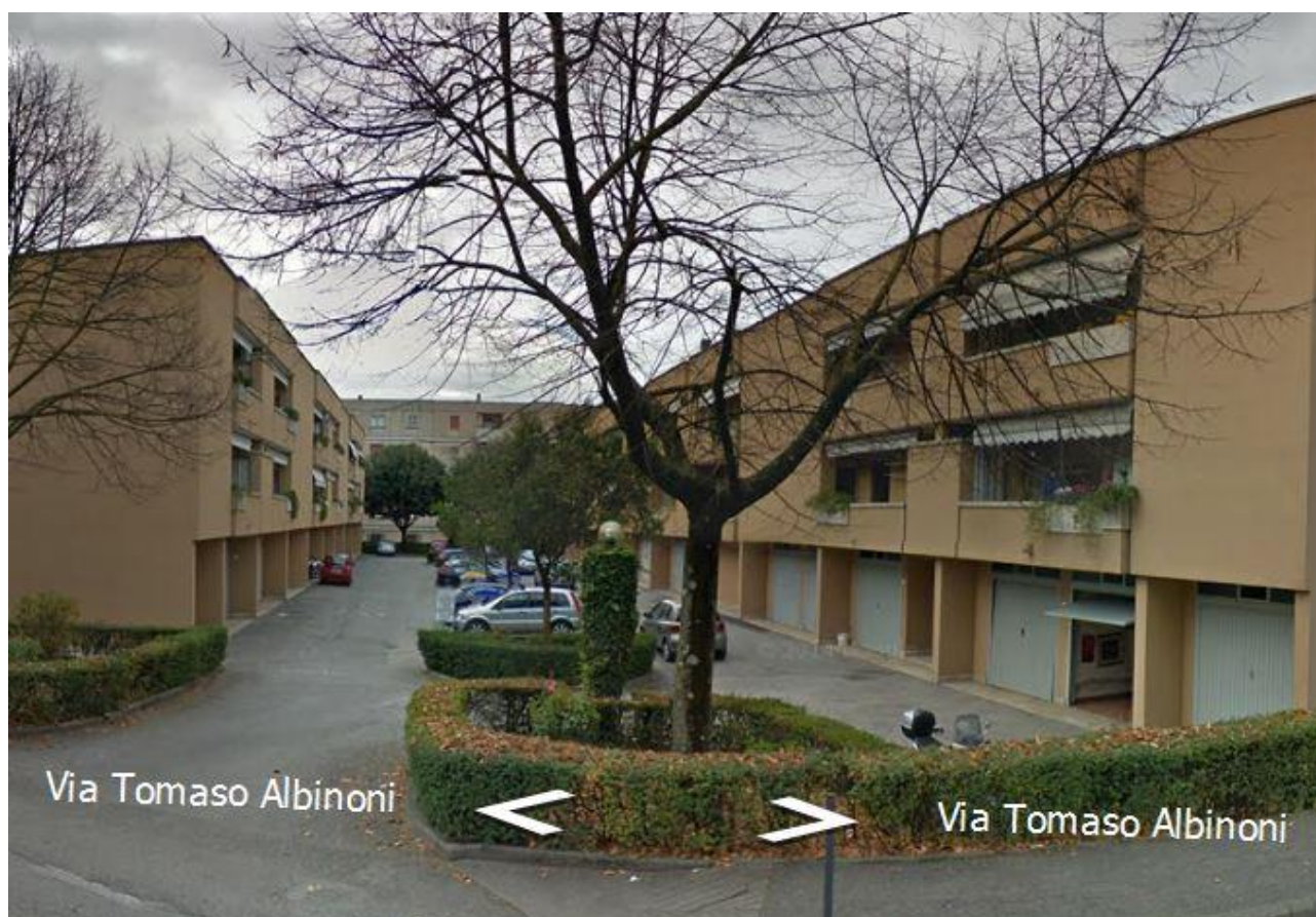
Gruppo L – Perugia – Via Tomaso Albinoni

Dal punto di vista territoriale i due segmenti sono disomogenei: il primo è diffuso ovunque e concentrato prevalentemente nei comuni oltre 50.000 abitanti, il secondo è più presente nei comuni sotto i 10.000 abitanti delle zone collinari interne del centro-sud.