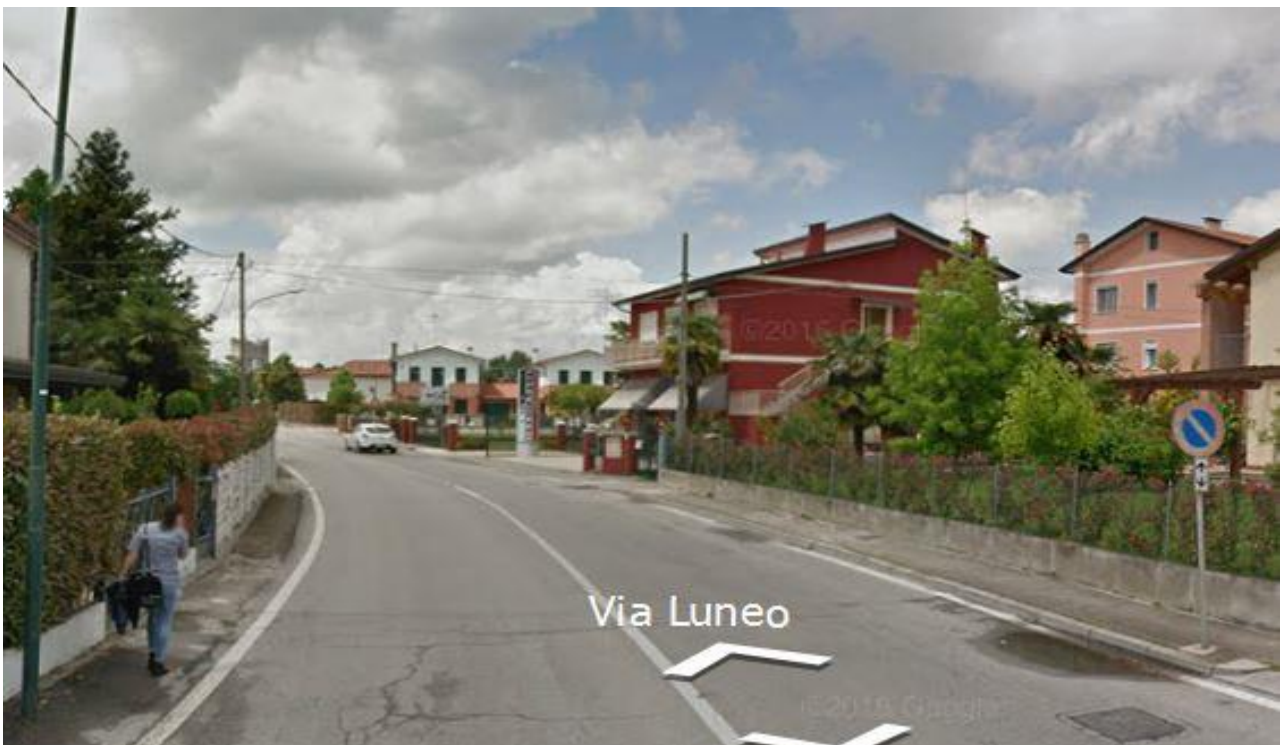
Gruppo E – Spinea (VE) – Via Luneo

E' concentrato principalmente nei comuni con meno di 20.000 abitanti del centro-nord.