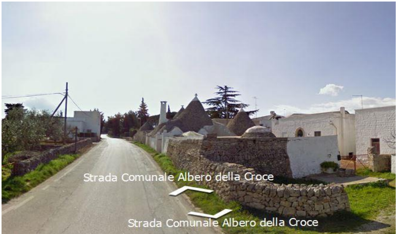
Gruppo I – Alberobello (BA) – Strada Comunale Albero della Croce

E' concentrato soprattutto al sud ed in alcune regioni del nord, nei comuni sotto i 20.000 abitanti.