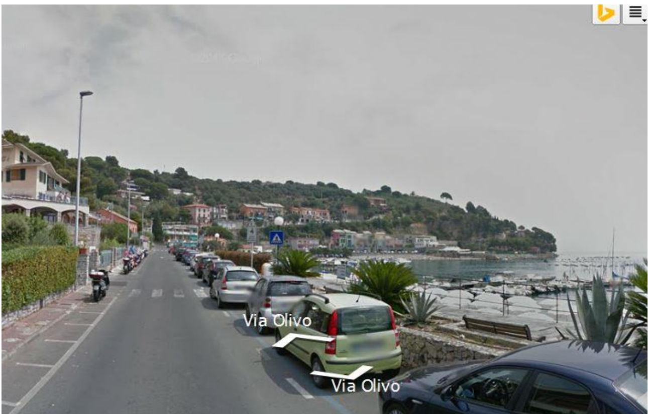
Gruppo F – Portovenere (SP) – Via Olivo

E' diffuso in tutta Italia ma prevalentemente nel centro-nord nei piccoli centri costieri o collinari non particolarmente ad economia rurale.