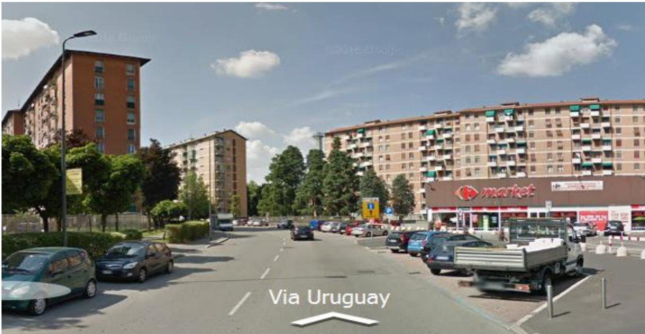
Gruppo B – Milano, Via Uruguay

E' concentrato principalmente nei quartieri semi-periferici, costruiti nella seconda metà del '900, dei comuni oltre i 20.000 abitanti ,soprattutto del centro nord.