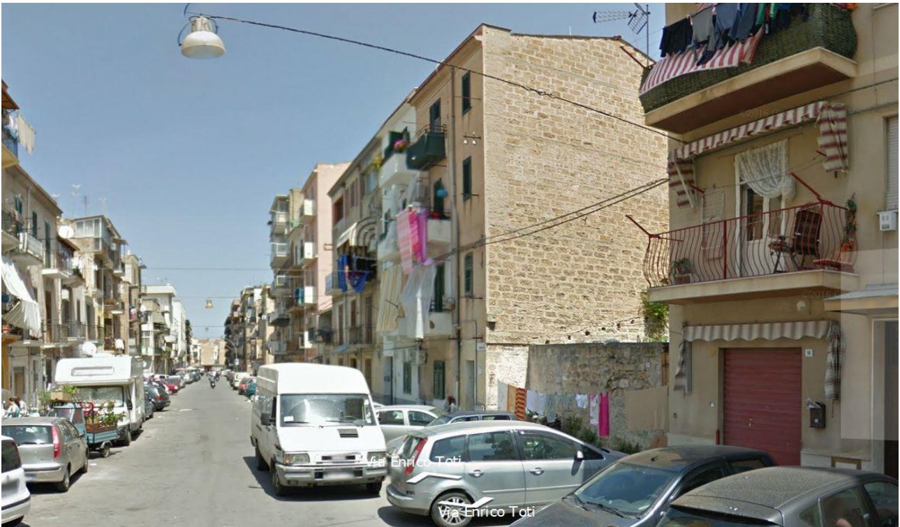
Gruppo G – Palermo – Via Enrico Toti

La tipologia delle abitazioni e l'epoca di costruzione varia a seconda del segmento di appartenenza. E' concentrato principalmente nel sud e nelle isole.