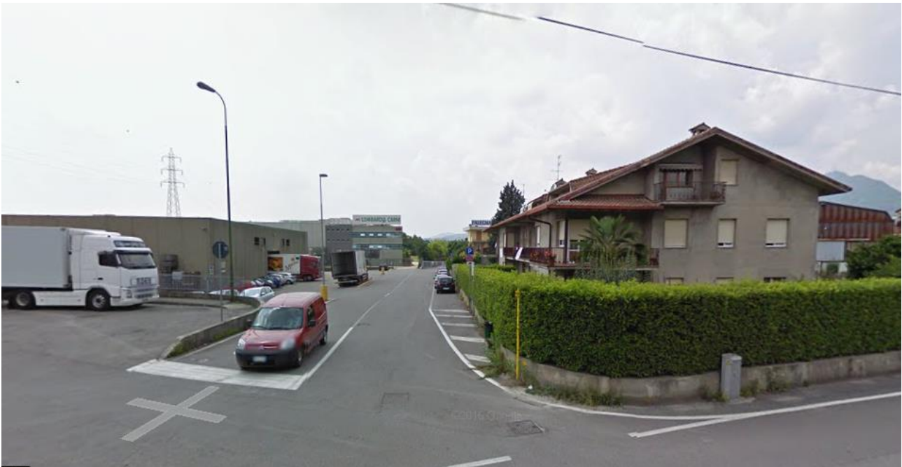
Gruppo H – Almè (BG) – Via Ponte Regina

E' concentrato principalmente nei comuni sotto i 20.000 abitanti del nord e del centro.